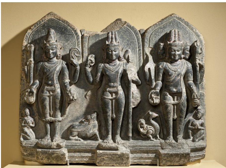
Вишну, Шива и Брахма

Кто же такой Шива? Один из богов Тримурти, создавших нашу вселенную (Брахма – создатель, Вишну – хранитель, Шива – разрушитель). Отсюда три основных направления индуизма: вайшнавизм – поклонение богу Вишну, шиваизм – поклонение богу Шиве, шактизм – поклонение божественной Матери – Шакти, в одной из её божественных форм. Но многобожие Индии не перечёркивает основную мысль Вед – Бог Один.