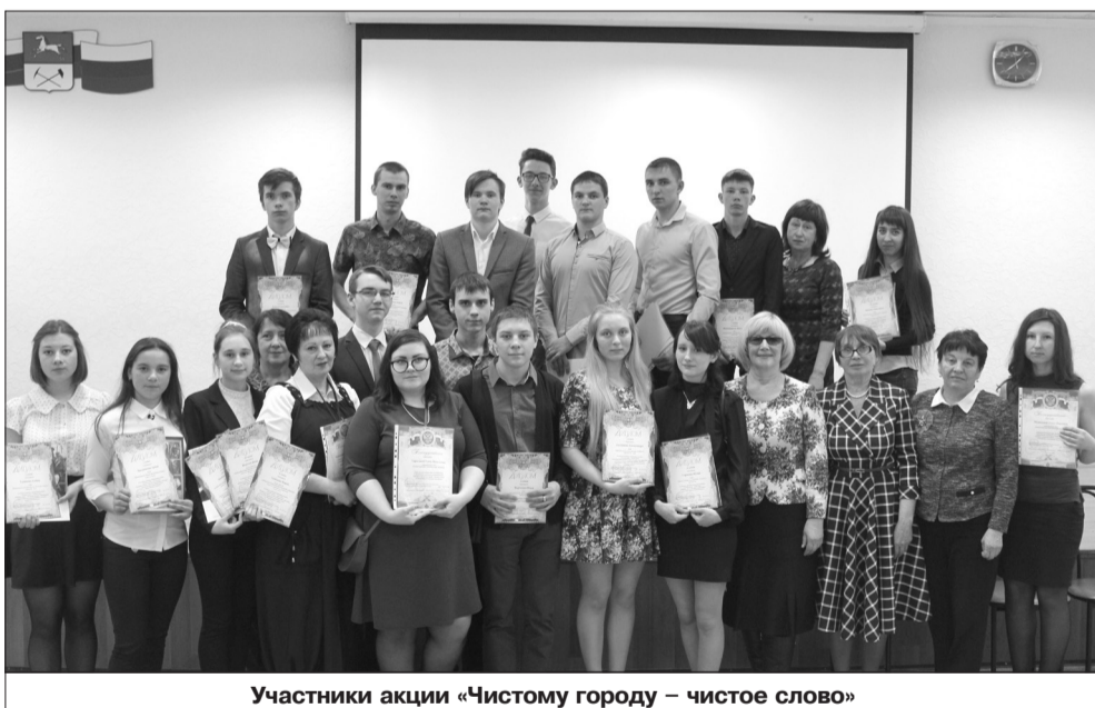
Участники акции «Чистому городу – чистое слово»

21 апреля 2018 года в филиале Кузбасского государственного технического университета имени Т.Ф. Горбачева города Прокопьевска состоялась подведение итогов ежегодного литературного конкурса в рамках акции «Чистому городу – чистое слово». В этом году организаторы конкурса – Прокопьевское отделение Международной Лиги защиты культуры (МЛЗК) и Союз женщин г. Прокопьевска, предложили его участникам, студентам образовательных учреждений, темы, раскрывающие понятия героизма и подвига.