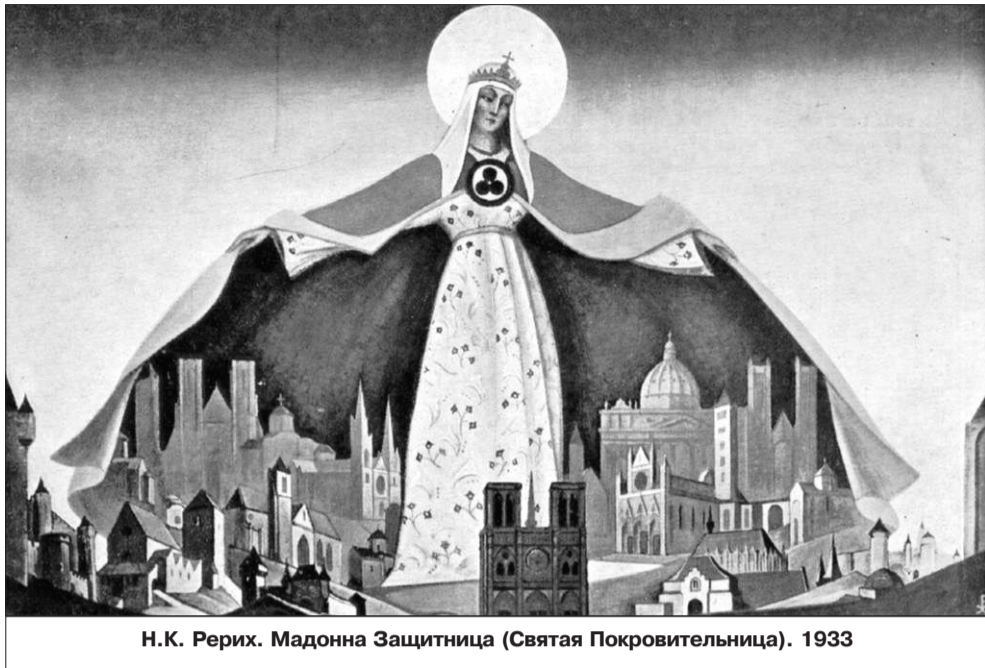
Н.К. Рерих. Мадонна Защитница (Святая Покровительница). 1933

Апрельская же весна 2018-го Серебряной нитью лигует духовные подвиги Великого Прошлого с феноменом Культуры, – с культуром, почитанием Света, утверждая восходящее Единство Мира. Так из «храмового сознания прозревается пространство Культуры»