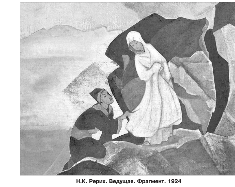
Н.К. Рерих. Ведущая. Фрагмент. 1924

Матвиенко отметила также, что все больше женщин приходят в политику и занимают высокие руководящие посты. Например, доля женщин в Совете Федерации сегодня достигла семнадцати процентов. Увеличивается представительство женщин в региональных парламентах. В десяти регионах женщины составляют среди депутатов от 22 до 45 процентов. Председатель Совета Федерации подчеркнула важность создания необходимых социальных условий, оказания поддержки женщинам в трудной жизненной ситуации: «Необходимо принять меры по расширению участия женщин