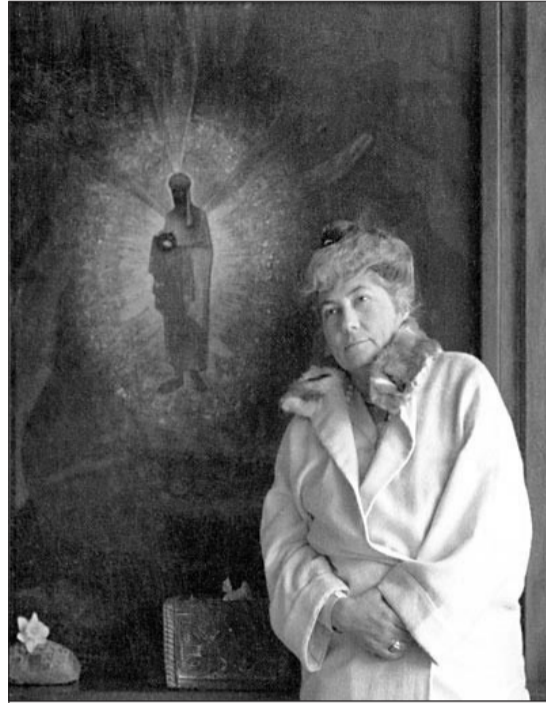
Е.И. Рерих возле триптиха «Fiat Rex!». Кулу (Индия), 1930 – 1940-е гг.

В памятный день пошлем всю любовь своих сердец и огненное устремление Той, которая в величайших трудах несменно с силами Света охраняет нашу планету. Приложим и мы свое устремление к этим Великим Трудам.