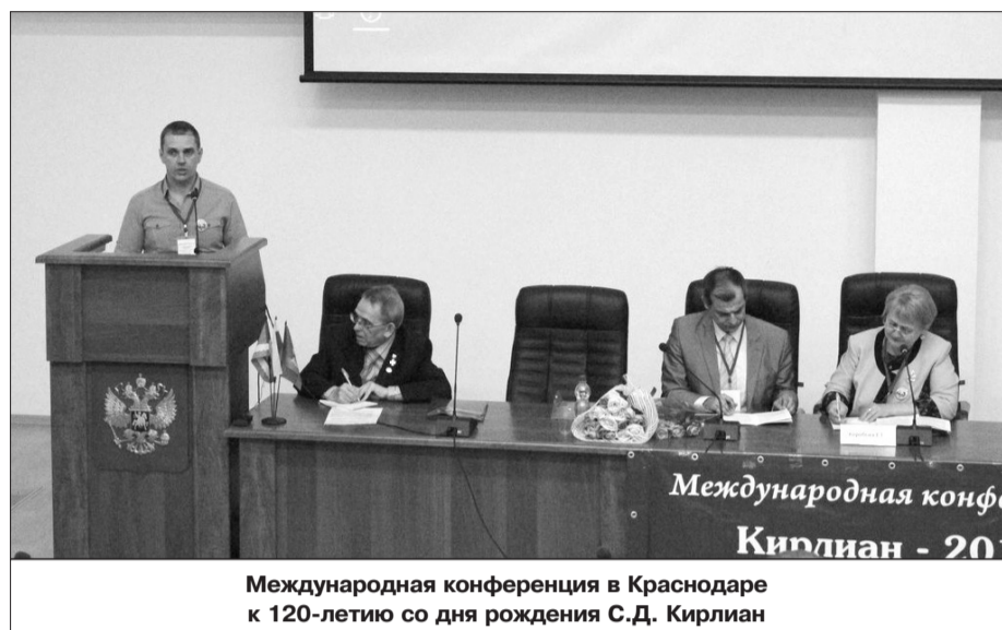
Международная конференция в Краснодаре к 120-летию со дня рождения С.Д. Кирлиан

С 20 по 22 февраля 2018 года город Краснодар и станица Динская стали местом общения ведущих ученых и общественности из Москвы, Санкт-Петербурга, Ростова-на-Дону, Новокузнецка и других городов России, а также из Англии, Голландии, Украины, Донецкой Народной Республики. Здесь проходила крупнейшая Международная научно-практическая конференция «На пороге будущих открытий», посвященная 120-летию со дня рождения знаменитого изобретателя и исследователя Семена Давидовича Кирлиан.