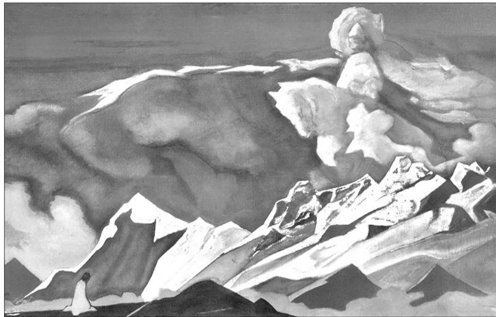
Н.К. Рерих. Калки Аватар. 1932

низмом противоположных полюсов. Так было и так будет всегда. Этим движется Эволюция мира. Только во времени меняются плоскости проявления противоположных начал, подчиняясь закону спирали. Конечно, события приближаются к завершению, с тем чтобы перейти уже на следующий виток спирали. Столкновения полярностей не избежать, оно уже происходит, и близится апогей. Старый мир обречен. Ничто уже его не спасет от уничтожения. Несмотря на ярое сопротивление, он вынужден сдавать одну позицию за другой. Он бессилен противодействовать этому. Отсюда его безумие и ряд удушающих и разлагающих его лагерей мер. Он готовит против себя страшный удар кармической справедливости во всепланетном масштабе. Но надо, чтобы разделение двух миров, Нового и старого, стало еще более глубоким и резким и произошло сосредоточение их сил на полюсах. Тогда границы удара будет очертить легче, чтобы не пострадали другие. Тучи сгущаются. Храните спокойствие, ибо вас не коснется событий волна, ибо вы под Щитом.