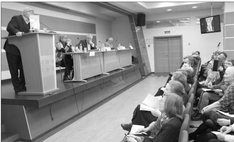
Международный съезд общественности в Москве 24 марта 2018 года

щие проблемы российской культуры и возможные пути их преодоления.