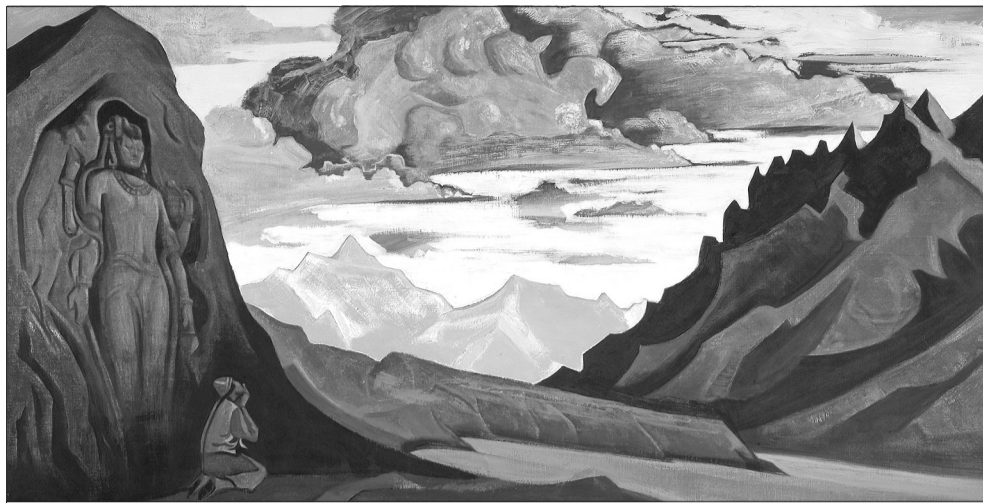
Н.К. Рерих. Майтрейя Победитель. Серия «Майтрейя». 1925.

Развитие сердца, новые научные открытия, подтверждающие основы Учения, и сотрудничество во всем также отличают век Майтрейи от прежней эпохи. «Ведь самая широкая кооперация начертана на знамени эпохи Майтрейи! – пишет Е.И. Рерих. – <...> Во имя благого сотрудничества для новой ступени совершенно неотложно усвоить зна-