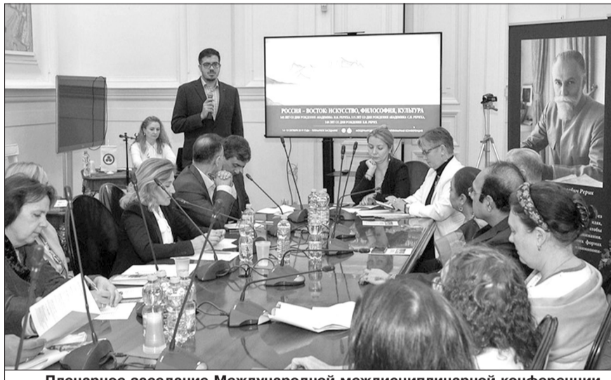
Пленарное заседание Международной междисциплинарной конференции «Россия – Восток: искусство, философия, культура».

Энергетика наследия Рерихов работает на благо России. Но сейчас, после событий 2017 года, когда Государственным музеем Востока при поддержке Министерства культуры РФ был осуществлен захват общественного Музея имени Н.К. Рериха в усадьбе Лопухиных, наследие особо нуждается в защите его материальной ос-