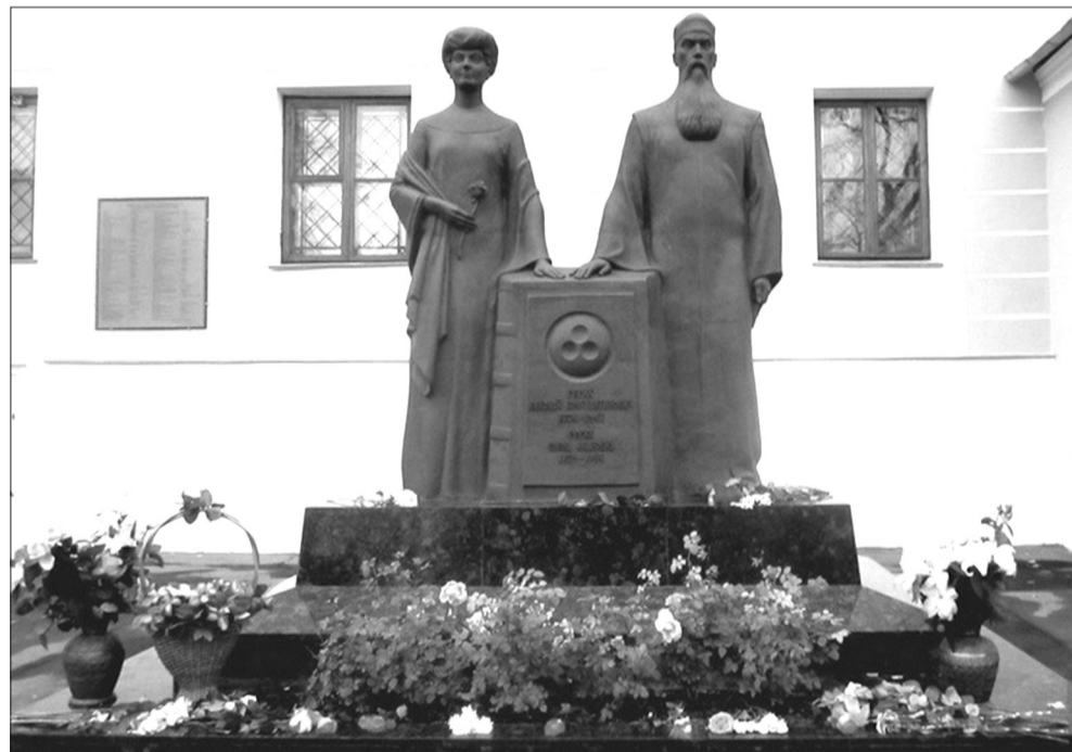
Мемориал Елены Ивановны и Николая Константиновича Рерихов в усадьбе Лопухиных в Москве.

Стыда за страну, которая, к сожалению, почти всегда так несправедливо обращается со своими великими людьми. Самой большой проблемой России Елена Ивановна Рерих считала «удушение мысли». Именно это обстоятельство становилось причиной преследования великих людей, которое для многих из них закончилось трагически. Достаточно вспомнить священника Павла Флоренского, Осипа Мандельштама, Всеволода Мейерхольда, а сколько философов, ученых, писателей и поэтов эмигрировало из России! Но история, как видно, ничему не учит, и намерение снести памятники Рерихам тому горький пример.