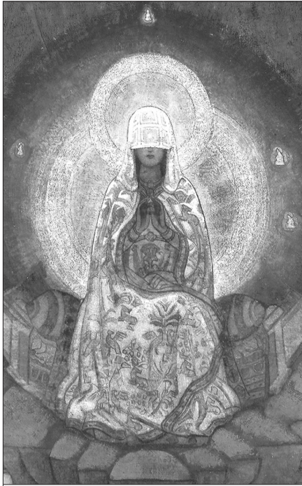
Н.К. Рерих. Матерь Мира. 1924. Фрагмент.