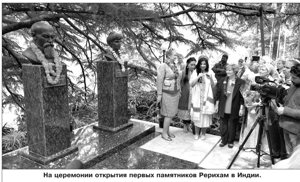
На церемонии открытия первых памятников Рерихам в Индии.

В знак нерушимой дружбы между Индией и Россией индийский и российский кураторы