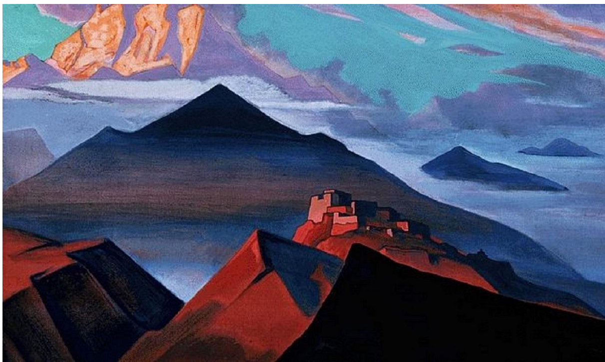
Н.К. Рерих. Святые горы. 1933.

Что такое Огонь? Однородное вещество или явление? Это явление неоднородное, состоящее из определенных элементов, проявлений, которые в целом и составляют огонь. Не представляя структуру огня, овладевать им бесполезно. Есть Указ Владыки: «Овладевайте Огнем». К чему он оглашен? К сроку, когда должна произойти смена эпох. Наступает Эпоха Владыки Майтрейи и Матери Мира, Эпоха Огня. Как мы войдем в нее, не имея представления, что мы должны делать, чтобы выжить в этих условиях?