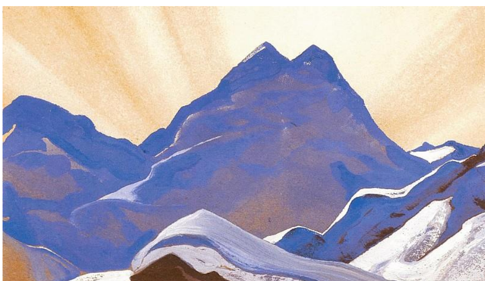
Н.К. Рерих. Гималаи. 1936–1937.