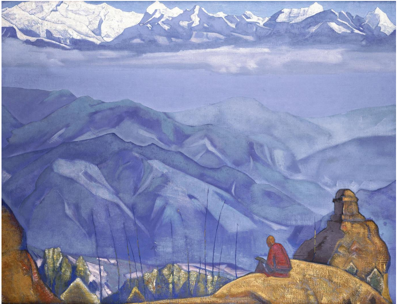
Н.К. Рерих. Книга мудрости. 1924.

* Опубликовано: «И Борис принесет кирпич на построение Нового Храма»: Сборник избранных статей, выступлений, писем, воспоминаний, посвященный 85-летию со дня рождения Б.А.Данилова. Новокузнецк, 2013.