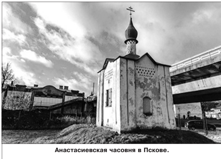
Анастасиевская часовня в Пскове.

«Проектная работа по реставрации живописи (не путать с собственно реставрацией), которая начнется в часовне на днях, пред-