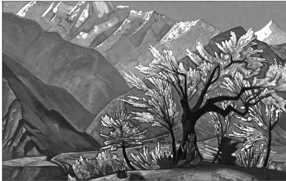
Н.К. Рерих. Кришна (Весна в Кулу). 1930.

Третий урок духовного познания, данный Кришной Арджуне, связан с бхакти-йогой, культивирующей любовь к Всевышнему. Когда человек предается кому-то, это изменяет всю его жизнь. В его уме не остается места для сомнений или вопросов. Преданность и служение злодею сделает человека таким же злодеем. Поэтому важно посвятить себя служению добру и истине. Это делает человека праведником. Высшая форма преданности – это бхакти, любовь к Богу. Кришна говорит, что постоянные размышления о Всевышнем пробуждают в сердце человека чувство любви к Нему. В бхакти, поясняет индийский философ Свами Вивекананда, «не преследуются никаких результатов, подвиги посвящаются наслаждениям и т.п., но все дела посвящаются Учителю учителей» [9, с. 90]. «Что бы ты ни делал, что бы ты ни ел,