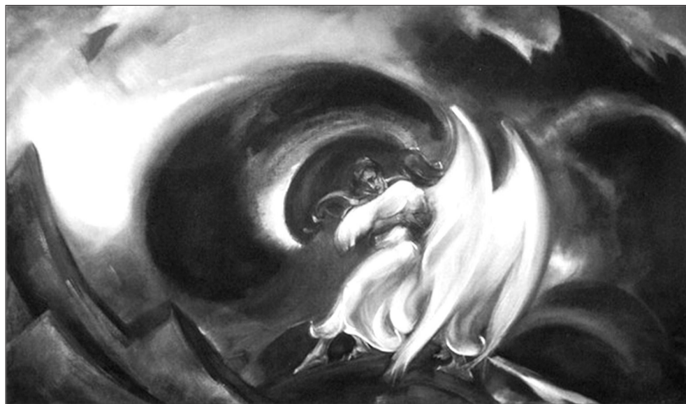
С.Н. Рерих. Яков с Ангелом (Иаков и Ангел). 1940.

(Сент. 26). Сказал: «Не мечите бисера...» Каждое даяние подвергает дающего опасности обратного удара, когда получающий тут же или время спустя стремится отблагодарить за полученное целым потоком сомнений, недоверия, критики и подозрений. По каналу даяния вся эта муть почти беспрепятственно вливается в сознание дающего, отравляя своим ядом его душу и тело. Можно ли удивляться, что такое соприкосновение нередко сопровождается заболеваниями. Ведь всю эту отраву приходится