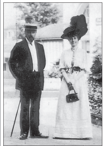
Николай Константинович и Елена Ивановна Рерихи

«Более чем когда-либо ясно, что без осознания духовного начала люди не найдут новых путей. Никакие конференции, никакие переустройства ничего не изменят и не остановят разложения человечества. Необходимо осознать сердцем, всем существом ведущее Духовное Начало, и тогда только многие жизненные противоречия и сложности найдут себе правильное объяснение и место. Только тогда народ сможет начать слагать новую культуру на основах неизбывных законов бытия. Начало этого осознания мы уже видим в произведениях молодых ученых, в своих изысканиях, подошедших к пределам, за которыми они уже вступают в область всяких «мета» - метафизики, метахимии и метабиологии и так далее. Истинно, пришлось одухотворить и биологию. Итак, в прогрессе своем наука должна будет признать примат духа, или духовности, во всем сущем. Будет найдено равновесие между идеализмом и материализмом, или между духовностью и материальностью... Наука, не окрыленная ведущим началом воображения, окажется в тупике».