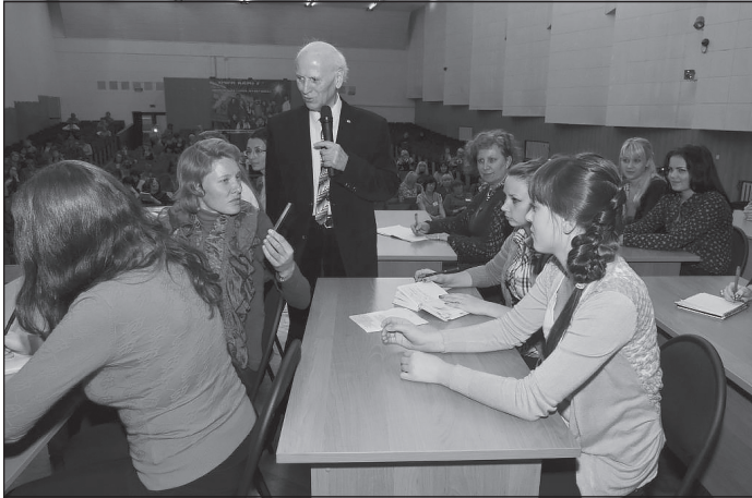
Авторский семинар академика Ш.А. Амонашвили в Новокузнецком филиале Кемеровского государственного университета

возвращала нас к самой сути – к тому, что и мы, и наши ученики – духовные существа, что доброта воспитывается добротой, а любовь любовью. Что у каждого педагога есть педагогическая совесть и ответственность не только перед работодателем, но и перед детьми, перед обществом и перед Богом.