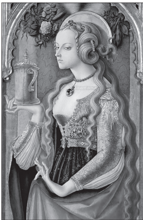
Карло Кривелли. Мария Магдалина. 1476. Фрагмент

вертое Евангелие раньше, чем традиционные (ортодоксальные) христиане. Самый старый известный комментарий к Четвертому Евангелию оставил гностик Гераклеон (180 г.). Валентинианские гностики-валентиниане присвоили себе это Евангелие до такой степени, что Иринею Лионскому (202 г.) пришлось опровергнуть их толкование.