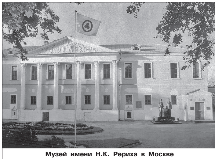
Музей имени Н.К. Рериха в Москве

Всем, кому дорого наследие Рерихов, его сохранение для будущих поколений, общественный Музей имени Н.К. Рериха и его дальнейшая деятельность