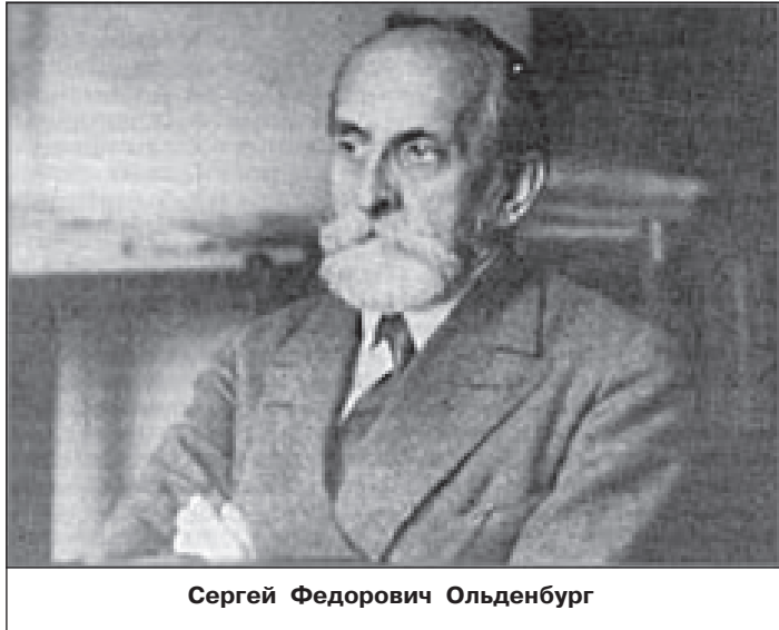
Сергей Федорович Ольденбург