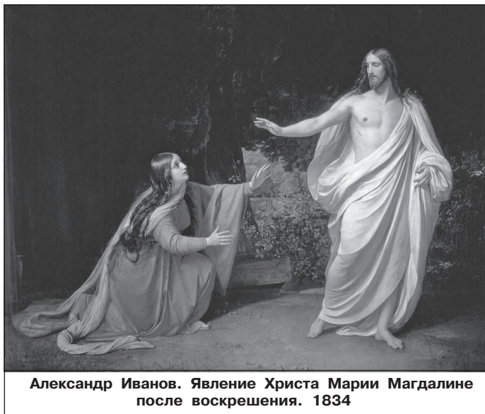
Александр Иванов. Явление Христа Марии Магдалине после воскресения. 1834

Если мы сравним этот текст с отрывком из Евангелия от Филипа, цитируемого ранее, мы заметим некоторые поразительные сходства. Было трое, всегда шедших с Господом: Мария - Его Мать, и Ее сестра, и Магдалина, которую называли Его спутницей. Каждую из них - Его Мать, сестру и спутницу звали Мария. Евангелие от Филипа делает ссылку на тех же самых женщин, стоящих возле креста