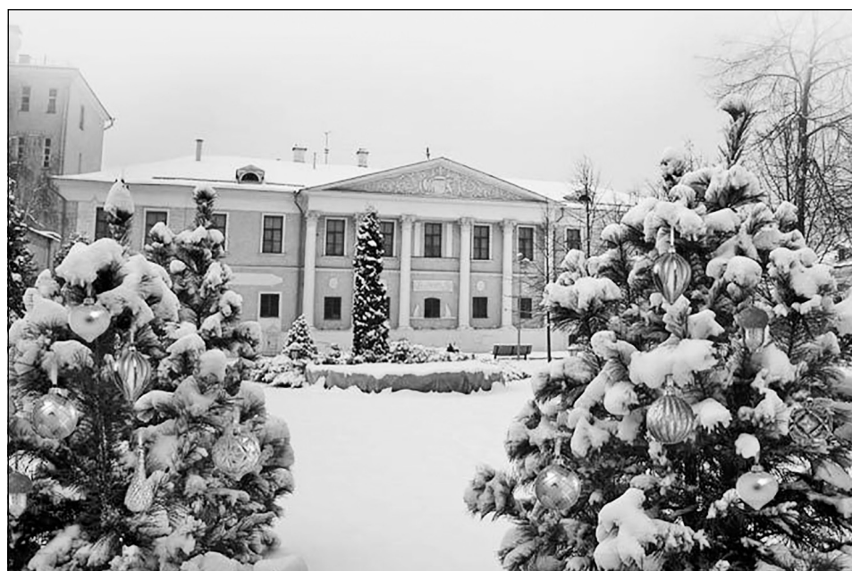
Музей имени Н.К. Рериха в Москве