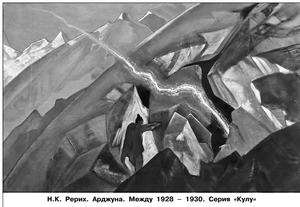
Н.К. Рерих. Арджуна. Между 1928 – 1930. Серия «Кулу»

Царевич – воин Арджуна, должен был сражаться за права своего брата, уничтожив того, кто захватил его престол и угнетал страну; его долг принца и воина – бороться за освобождение своего народа и за восстановление порядка и мира. Положение усугублялось тем, что его близкие родственники и товарищи стояли на той и другой стороне, надрывая сердце Арджуны мукой и сомнениями. Мог ли он убить тех, кого любил и почитал, и пренебречь узами родства? Нарушить семейное начало – грех, но и оставить народ под игом угнетателя – также грех. В чем же состоит его долг? Справедливость должна быть соблюдена, иначе будет погран закон (дхарма); но может ли убийство быть безгрешным? Ответом служит главный смысл книги: не имей личного интереса в событии; совершай долг, указанный твоим положением в жизни; любовью достигни слияния с Высшим, а затем испол-