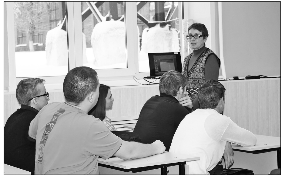
На встрече со студентами Прокопьевского электромашиностроительного техникума, посвященной Дню матери

Таким образом, перед семьей, школой, всем обществом стоит ответственная задача по созданию условий для того, что-