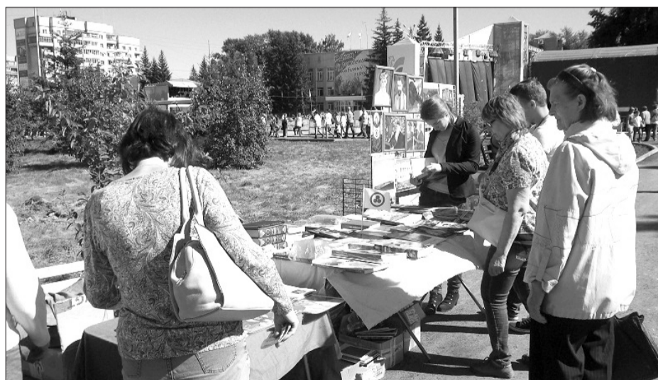
Жители Бердска знакомятся с выставкой книг и репродукций картин Н.К. и С.Н. Рерихов

С 1783 по 1797 год Бердск именовался городом Кольванью и был центром Кольванской губернии, в состав которой входило пять уездов: Кольванский, Семипалатинский, Бийский, Кузнецкий и Красноярский. Обширная территория губернии на юге граничила «с землей Киргиз-Кайсаков», ее западную границу составляла река Иртыш, а «знатную часть восточных границ – река Кан». Число жителей доходило до 170 тысяч душ. За годы губернского правления Бердск (тогда Кольвань) значительно расстроился, появились новые улицы, увеличилось количество торговцев и ремесленников. В 1797 г. Кольванскую губернию упразднили, территория ее вошла в состав Тобольской губернии. Город Кольвань стал именоваться Бердской слободой, чуть позже – волостным селом