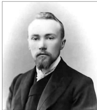
Николай Константинович Рерих. 1901 год

«...Мне вообще хочется, чтобы все тяжкое и трудное, что стоит впереди меня и всего человечества, – чтобы все оно наступило скорее и чтобы единым духом все преодолеть для стремительного движения вперед, поскольку хватит сил. В прошлом и в настоящем много ужаса в мире. Чувствую, как сгущаются знаки кругом и как хочется крикнуть: «Скорее!» Больше и больше бунтует нетерпеливый дух. Не знаю, хорошо ли это».