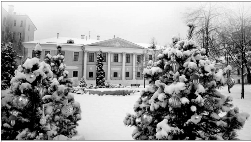
Общественный Музей имени Н.К. Рериха в Москве

Идея создания в России общественного Музея имени Н.К. Рериха принадлежит младшему сыну Николая Константиновича и Елены Ивановны – известному художнику, ученому, писателю и общественному деятелю Святославу Николаевичу Рериху. 29 июля 1989 года С.Н. Рерих в газете «Советская Культура» опубликовал открытое письмо «Медлить нельзя!», адресованное советской общественности, с изложением концепции создания общественного Музея имени его отца. Совет Министров СССР поддержал инициативу Святослава Николаевича Постановлением от 4 ноября 1989 года «О Советском Фонде Рерихов и Центре-Музее имени Н.К. Рериха». Святослав Николаевич встречается и ведет переговоры с представителями общественности Москвы,