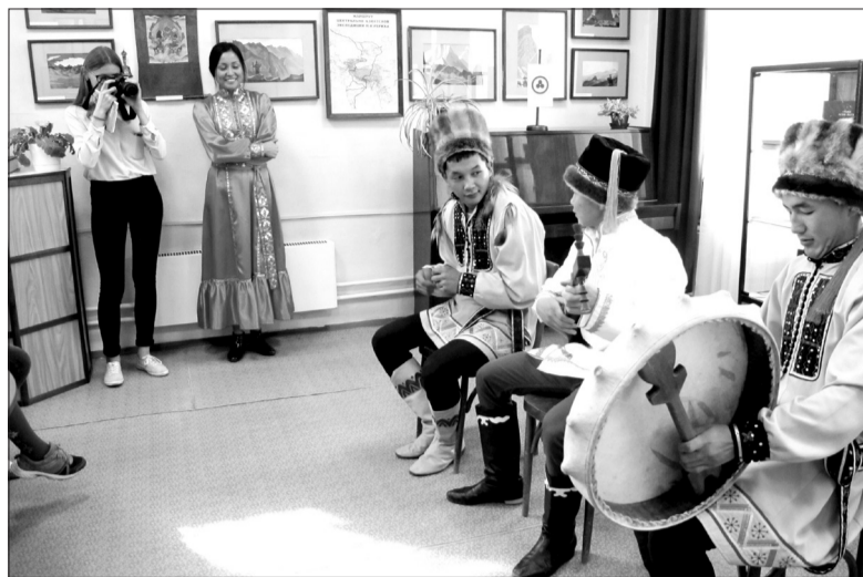
Выступление музыкального коллектива Центра шорской культуры «Аба-Тура»

Культуре шорского народа был посвящен специальный день Недели культуры. В общении с музыкальным коллективом Центра шорской культуры «Аба-Тура» четвероклассники гимназии № 32 познакомились с национальными музыкальными инструментами – кай-комусом, топшуром, бубном, послушали