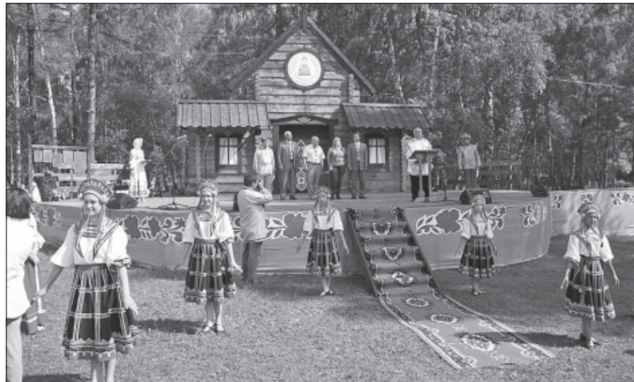
Открытие Межрегионального фестиваля русского народного творчества «Родники Алтая» в Усть-Коксинском районе Республики Алтай