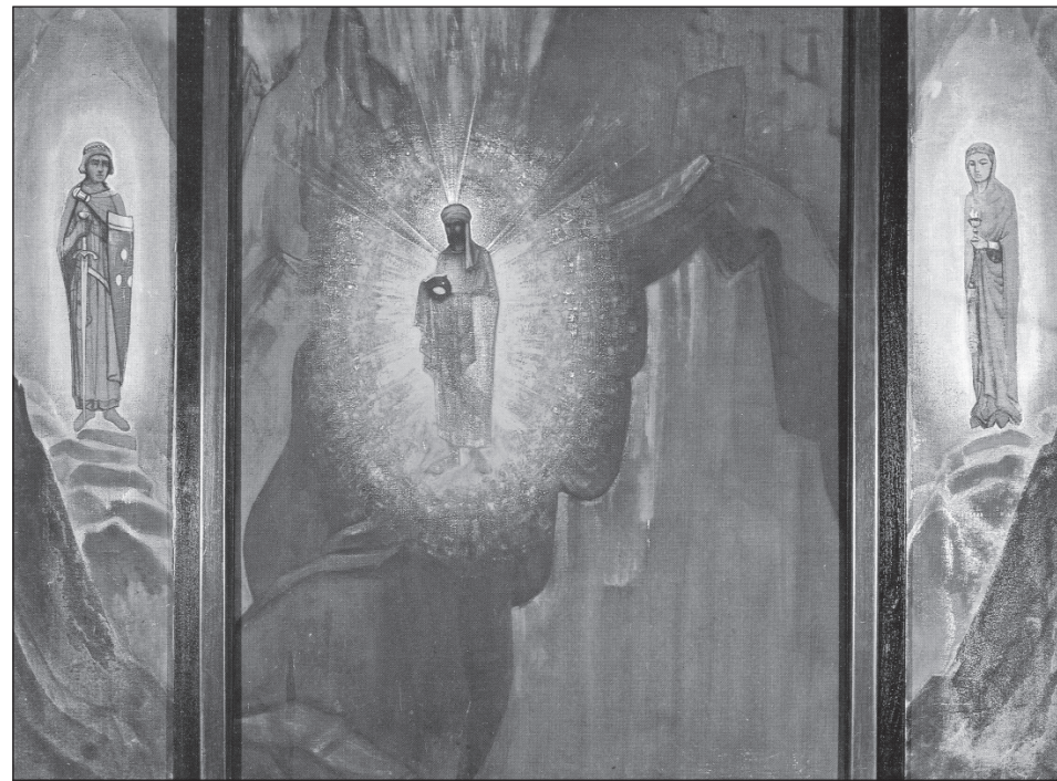
Н.К. Рерих. Fiat Rex! Триптих. 1931

Материал для публикации предоставлен Б.А. Даниловым , учеником Б.Н. Абрамова .