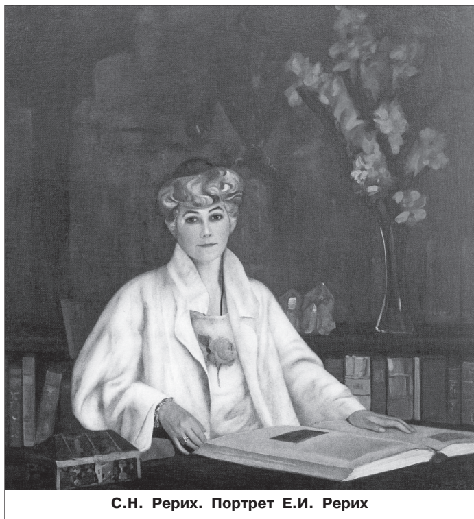
С.Н. Рерих. Портрет Е.И. Рерих