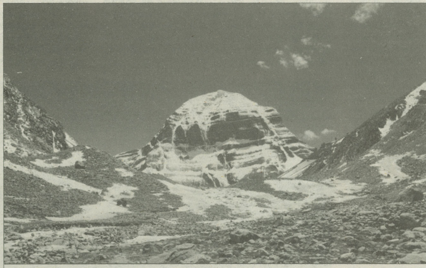
Священная гора Кайлас.

ми, имеющими вогнутую форму, подобно лепесткам лотоса. Все вместе они образуют природную мандалу Кайласа, с помощью которой осуществляется информационно-энергетическая связь с другими структурами Мироздания.