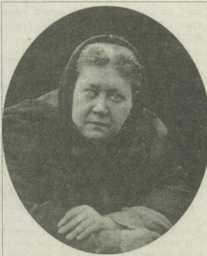
Елена Петровна Блаватская. Фото 1888 – 1889 гг.

«Есть путь, нелегкий и тернистый, изобилующий всевозможными опасностями, но все же существующий, и ведущий к самому сердцу Вселенной. Я могу рассказать, как найти тех, кто укажет вам тайные врата, открывающиеся только внутрь, но тут же и навсегда захлопывающиеся за неофитом, ступившим за них. Нет опасности, не преодолимой бесстрашной отвагой; нет испытания, которое не могла бы пройти безупречная чистота; нет трудности, с коей не справился бы сильный разум. Тех, кто побеждает, ждет впереди награда, которую не описать никакими словами, – власть благословить и спасти человечество; для тех, кто проиграл, впереди – множество жизней, в которых еще может прийти успех».