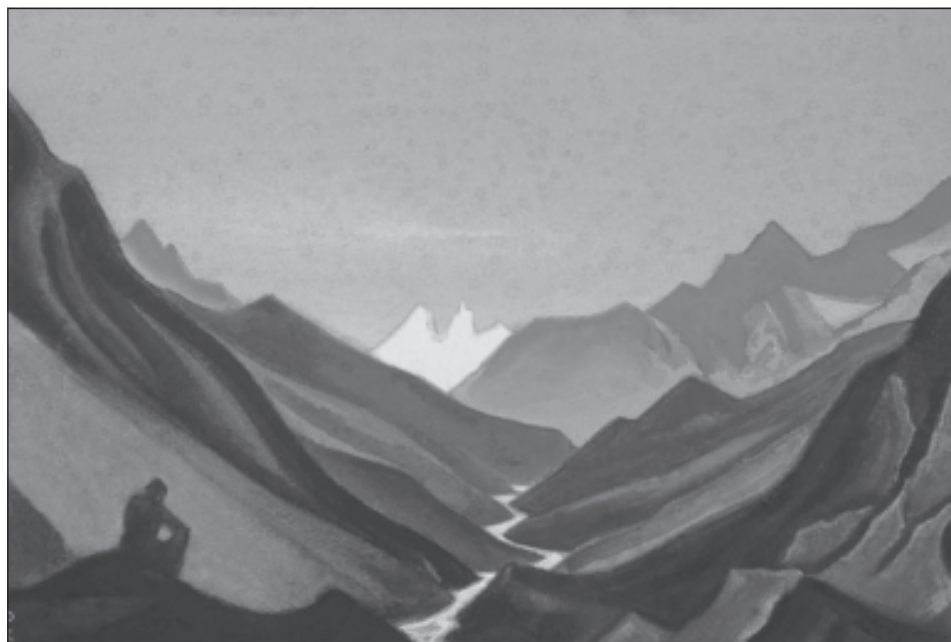
Н.К. Рерих. Гималаи (Приказ Учителя). 1943

в Мир Космический, сливается с ним и становится миром сверхличным, или миром духа, не утрачивая своей Индивидуальности как центра сознания, ибо сознание переносится выше и уже не обнимает собою элементы, подлежащие смерти и разрушению. Если, будучи красивым и здоровым, всю цель и смысл жизни вложить в эти явления, то каково же горе будет при их утрате, ибо обречены на смерть и красота тела, и его здоровье. Только перенося сознание в не-