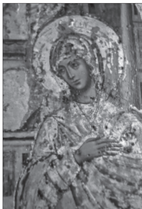
Икона Богородицы из храма Благовещения в Назарете