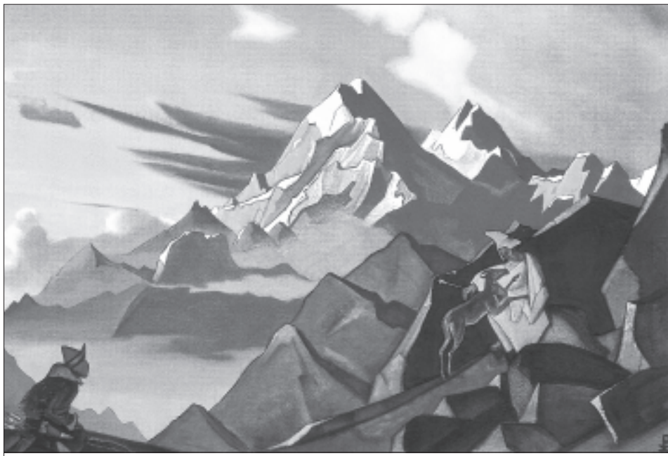
Н.К. Рерих. Сострадание. 1936

Учение выделяет понятие зерно духа , той божественной искры, которая содержится в каждой монаде при ее рождении от Луча Высочайшего Духа Иерархии Света. В процессе длительной эволюции вокруг зерна духа собираются энергии, составляющие сознание. Сознание имеют представители минерального, растительного и животного царств. «Сознание лежит в основании Вселенной. Каждый атом наделен сознанием; где жизнь, там и сознание, но, конечно, степени сознания и осознания беспредельны» [6, с. 177]. Степень самосознания присуща только человеку . В человеке происходит сознательное или