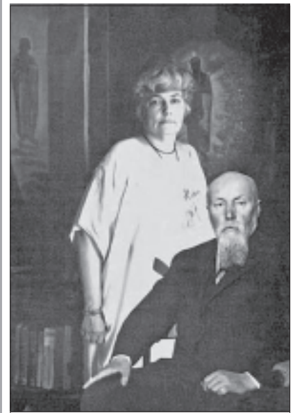
Елена Ивановна и Николай Константинович Рерихи