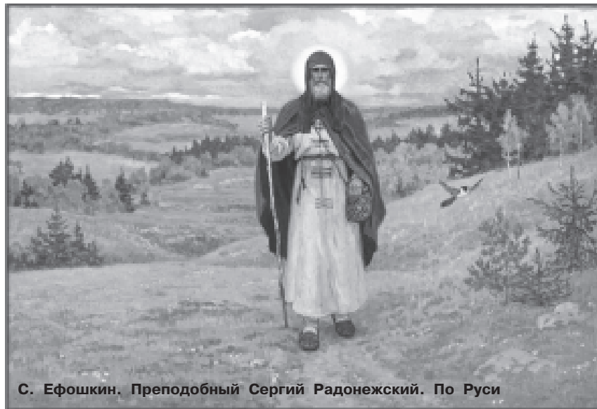
С. Ефошкин. Преподобный Сергий Радонежский. По Руси

Следующее путешествие преподобный Сергий предпринимает уже в Москву. По