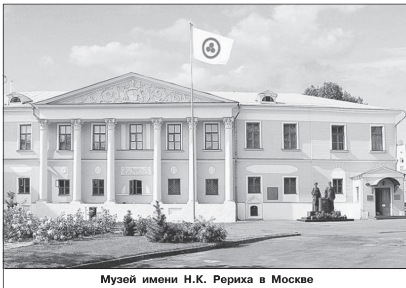
Музей имени Н.К. Рериха в Москве

Многолетняя деятельность музея по популяризации миротворческих идей Н.К. Рериха, несомненно, способствует росту авто-